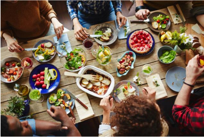
Neue Kulturen kennenlernen