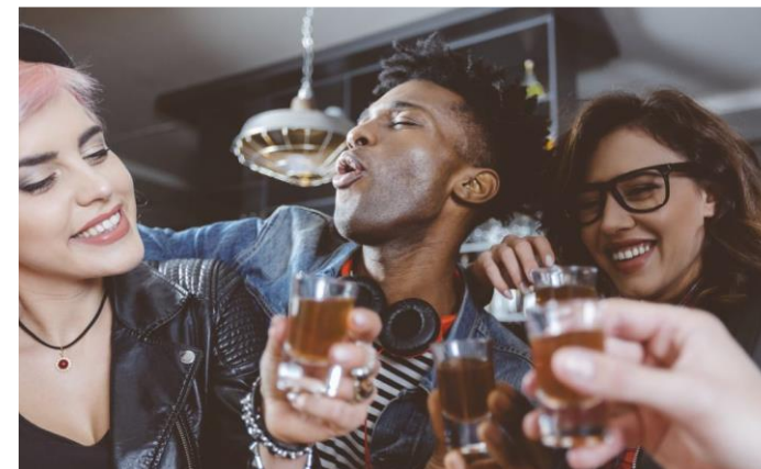
Neue Beziehungen erstellen