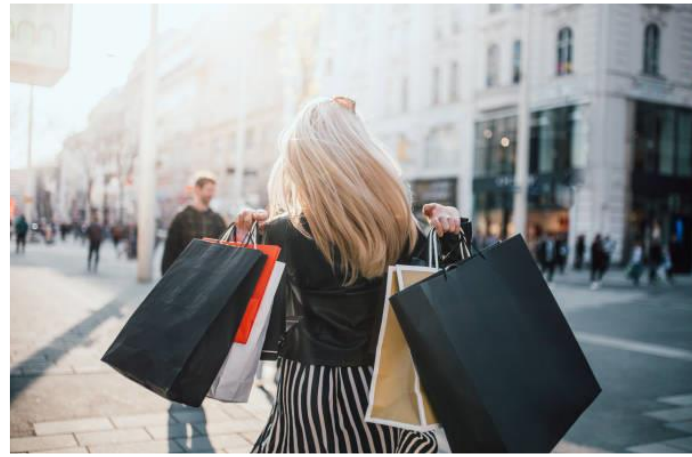
Berufliche Chancen verbessern