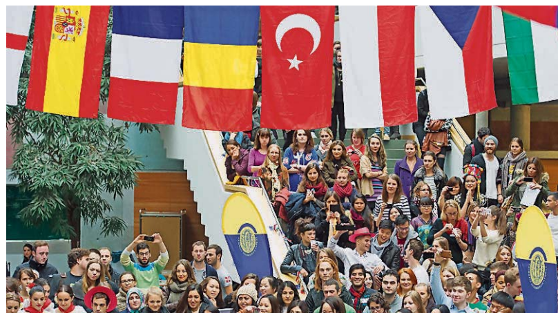
Bevor Studenten ein Auslandspraktikum antreten, sollten die zu übernehmenden Aufgaben definiert sein.

VER SICHERUNGS KAMMER BAYERN Ein Stück Sicherheit.