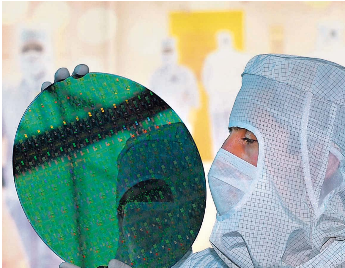
Mikrochip-Herstellung ist auch weiterhin ein Schlüssel des Fortschritts.

„Daneben erweitert die regelmäßige Einbindung interessierter Studierender in Forschungs- und Praxisprojekte deren Qualifikation und Kompetenzen ganz enorm“, ergänzt Antoni Picard, Professor im Studiengang MNT und Sprecher des Netzwerkes „pro-mst“, einen weiteren positiven Aspekt der angewandten Forschung im Rahmen der Studienprogramme. Nach einer